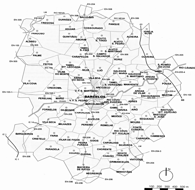
Figura 2 – Mapa de delimitação geográfica do concelho de Barcelos

O concelho de Barcelos é hoje composto por 89 freguesias. O Cávado desempenha, tradicionalmente, a fronteira entre Alto Minho e Baixo Minho. As freguesias de S. Martinho e Sta. Marias de Galegos, referentes à área da produção de figurado, encontram-se na margem direita do rio, numa região com grandes depósitos sedimentares e, conseqüentemente, grandes barreiras.